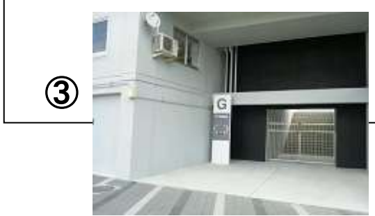
陸上競技場 メインスタンド1F