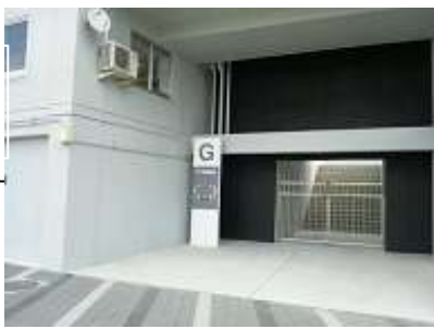
陸上競技場 メインスタンド1F